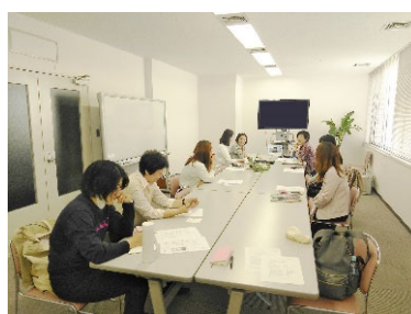
勉強会・キャリアセミナー等 (随時開催)