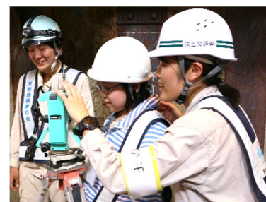
次世代育成活動 (全国で開催)