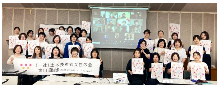
総会 (年1回、全国から会員が集合)