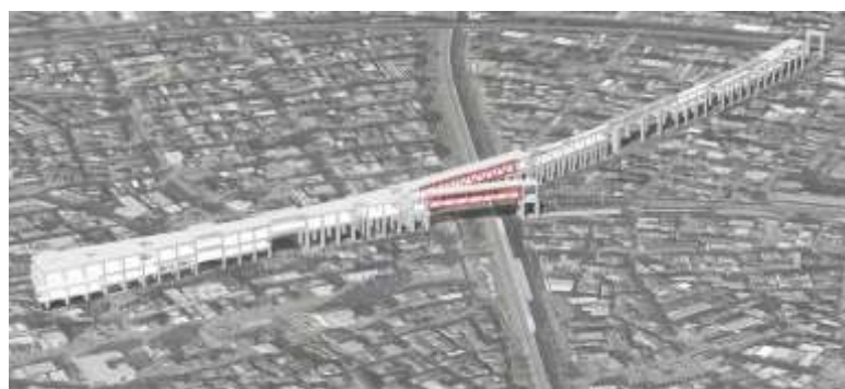
淡路駅 完成予想図

「私の現場(職場)ではこんな取組みをしています」各自で”働き方改革のネタ”を持ち寄って、意見交換を実施します。ネタは何でもOK!他箇所での取組みを吸収して、自分の仕事に活かしましょう!