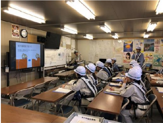
TRD 工法についての説明