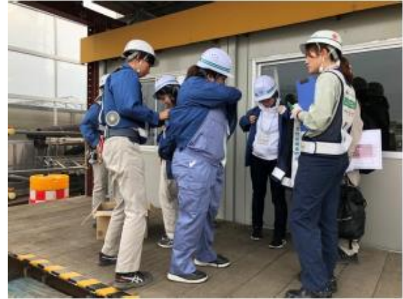
空調服の試着の様子