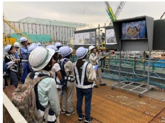
シールドマシンの組み立て動画確認