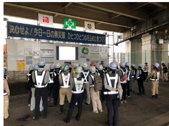
カントクさん体験 (朝礼台・モニター)