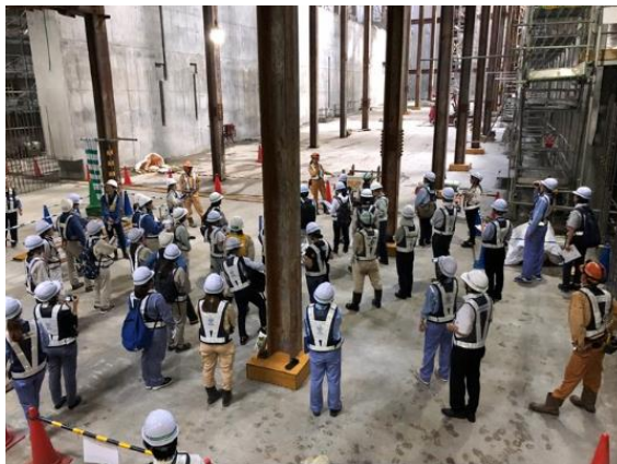
開削工事現場の様子