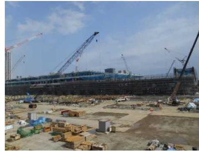
豊洲新市場工事現場