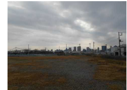
選手村予定地の現況