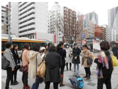
勝どき駅(地上)にて工事の概要説明

地下鉄大江戸線勝どき駅では、ホームを1面増設する、拡幅工事が行われており、現在は、土留め、中間杭の施工がされています。列車の運行を妨げることなく工事が進められています。平成30年完成予定となっています。