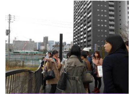
選手村予定地前にて説明

選手村の予定地を訪れました。大会終了後の選手村の利用については、まだ、具体的になっていません。多様な人々が交流し快適に暮らせるまちづくりをコンセプトとして、事業協力者と連携をはかりながら、選手村の設計を進めていく方針となっています。