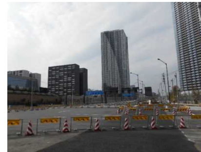
整備中の環状2号線

環状2号線は、現在、虎ノ門から豊洲までの間5kmの整備が進められています。この区間の完成によって、都心部の渋滞緩和や臨海部と都心部を結ぶ交通・物流ネットワーク機能の強化、また、臨海部の防災性向上が期待されています。手前の豊洲大橋は完成していますが、前後の区間が未整備となっていることから、この橋はまだ通れません。