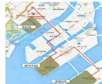
文責 東日本支部 北原