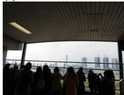
市場前駅より現場の様子を見学

「食の安全・安心」を目指し、築地から豊洲へ市場を移設する計画になっています。土壌汚染対策として、土壌を浄化するプラントを設置し、浄化した土に置き換える作業を行ったとのことでした。その作業が最近完了し、これからは、建物関係の工事に移り、H28年度の開場に向け、急ピッチで工事が進められていくそうです。「食」を中心にした東京の新たな観光名所として期待されています。